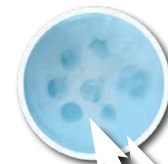
Dopo il trattamento

Per un risultato ottimo e per prevenire problemi respiratori o situazioni allergiche nei passeggeri, si consiglia di effettuare un intervento con AIR+ di TEXA ogni 6 mesi.